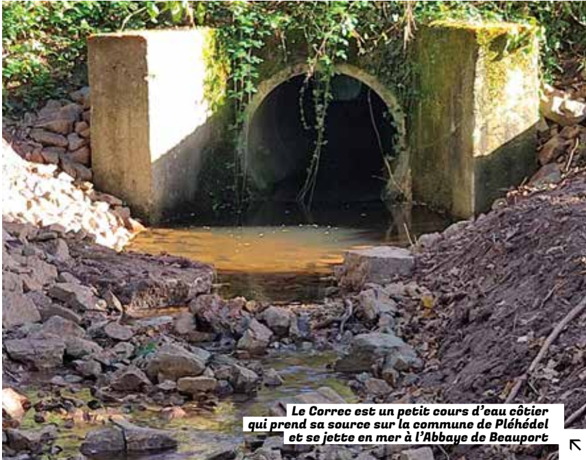
Le Correc est un petit cours d'eau côtier qui prend sa source sur la commune de Pléhédel et se jette en mer à l'Abbaye de Beauport

REDONNER VIE AUX COURS D'EAU ET AUX RIVIÈRES