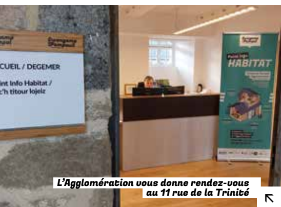
L'Agglomération vous donne rendez-vous au 11 rue de la Trinité