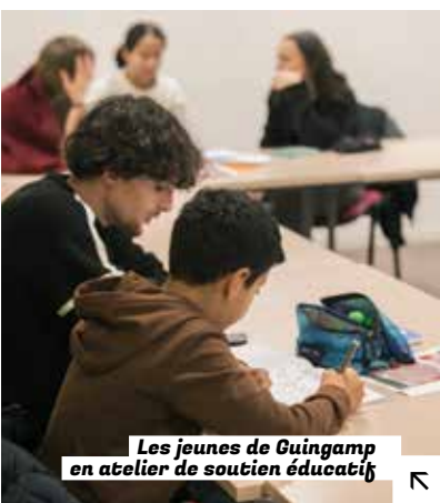
Les jeunes de Guingamp en atelier de soutien éducatif

Pour les jeunes de plus de 11 ans, des actions spécifiques sont organisées : l'atelier de soutien éducatif, qui se tient deux soirs par semaine, et la semaine de pré-rentrée pour préparer les futurs collégiens à l'entrée en 6 e . En favorisant un environnement de réussite, le service jeunesse, participe activement à la dynamique positive de ces quartiers, valorisant et ouvrant des horizons nouveaux pour la jeunesse du territoire. ●