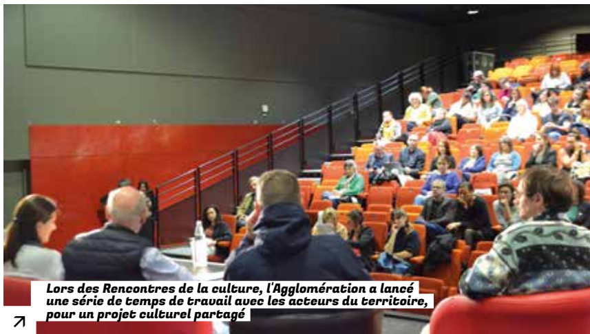
Lors des Rencontres de la culture, l'Agglomération a lancé une série de temps de travail avec les acteurs du territoire, pour un projet culturel partagé

Sur notre territoire, depuis longtemps, un grand nombre d'acteurs œuvre pour permettre à tous de découvrir et pratiquer des activités culturelles. Guingamp-Paimpol Agglomération apporte son soutien financier ou logistique dès que possible.