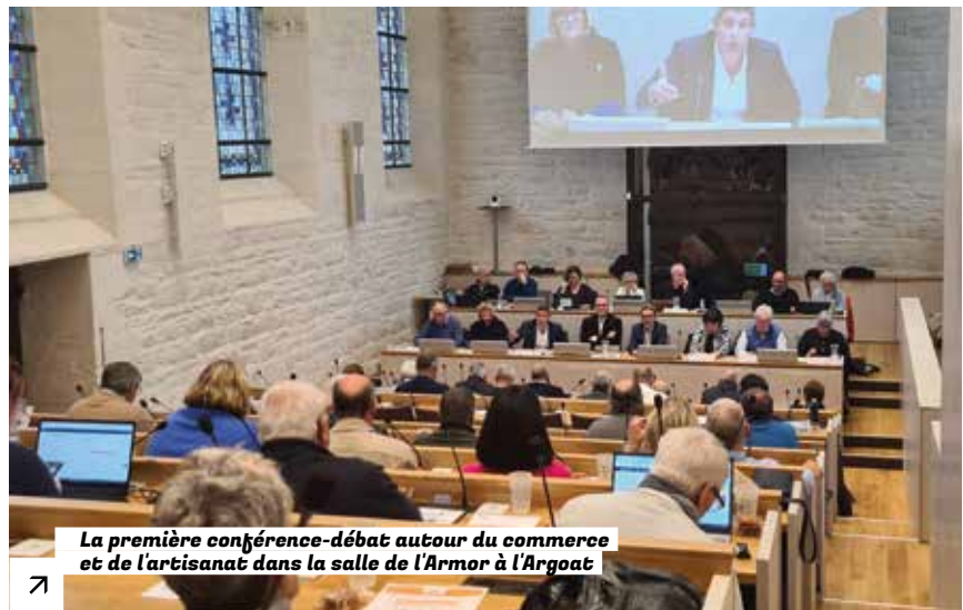
La première conférence-débat autour du commerce et de l'artisanat dans la salle de l'Armor à l'Argoat

Le premier Conseil d'agglomération y a eu lieu le 15 octobre 2024, en public et diffusé sur les réseaux sociaux, avec une toute nouvelle formule puisqu'il s'est ouvert avec un temps de conférence-débat sur le commerce et l'artisanat, avec l'intervention d'experts du sujet et un échange ouvert à tous. Ce nouveau temps d'information et de débat est proposé pour répondre à un contexte de crise démocratique : beaucoup de citoyens ont en effet besoin de mieux comprendre les grands enjeux actuels, comment sont prises les décisions et qui sont leurs élus.