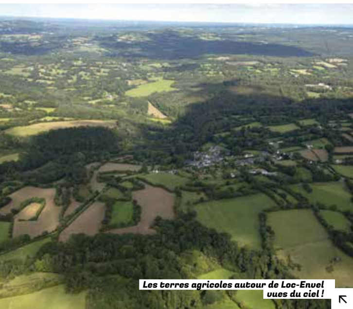
Les terres agricoles autour de Loc-Envel vues du ciel!

DÉVELOPPER UNE CULTURE DU CONSOMMER LOCAL