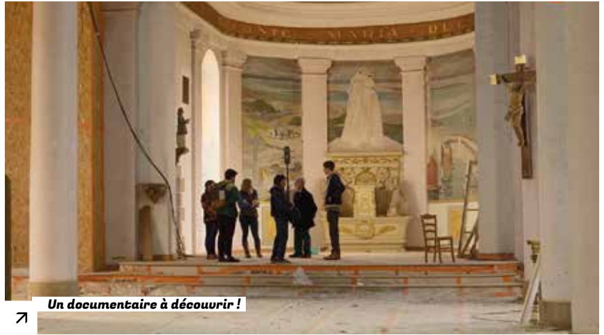
Un documentaire à découvrir !

Dans l'Agglomération de Guingamp-Paimpol, des églises se vident et se dégradent, et avec elles, c'est une part de notre patrimoine qui s'efface. Le documentaire « Du sacré aux communs » propose une immersion au cœur de cette réflexion sur le devenir de ces lieux chargés d'histoire. Durant quatre jours, chercheurs, élus et habitants se sont rencontrés pour envisager d'autres vies pour ces édifices : lieux de rencontre, d'art, d'initiatives locales ? Entre dialogue, échanges et découvertes, ce film révèle les défis et questionne les possibilités d'ouverture vers un changement d'usages ancrés dans l'avenir du territoire. À voir pour repenser ensemble notre patrimoine. ●