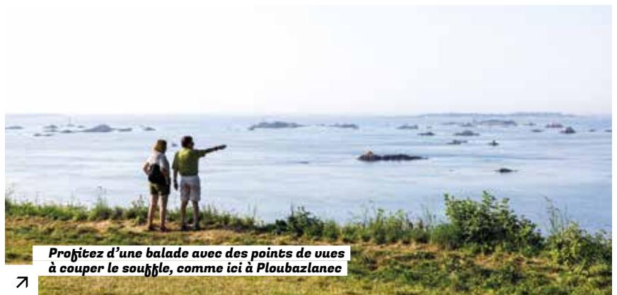
Profitez d'une balade avec des points de vues à couper le souffle, comme ici à Ploubazlanec

Téléchargez les fiches rando-bus sur le site www.guingamp-paimpol.mobi et partez à la découverte de nouveaux horizons !