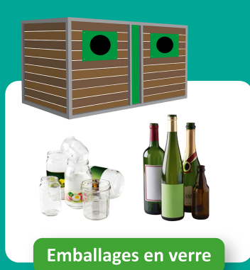
Emballages en verre