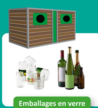
Emballages en verre

SANS LES BOUCHONS ET LES COUVERCLES INUTILE DE LAVÉ LES EMBALLAGES, IL SUFFIT DE BIEN LES VIDER